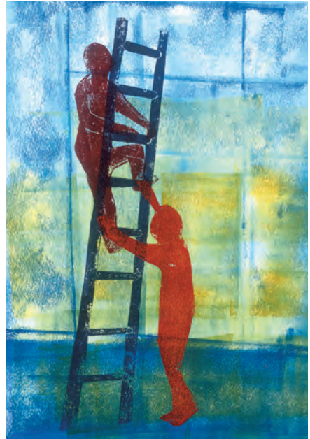
Barmhartigheid (Davide Meindersma)

In het najaar van 2023 vindt de leerroute plaats op drie zaterdagen: zaterdag 30 september, zaterdag 28 oktober en zaterdag 25 november.