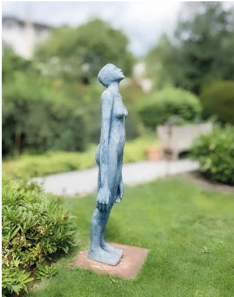
Beeld van Josette Tamarcaz, in Les Jardins de la Préfecture, Sion, Zwitserland

Doe uw schoenen van uw voeten, want de plaats, waarop gij staat, is heilige grond. (Exodus 3:5)