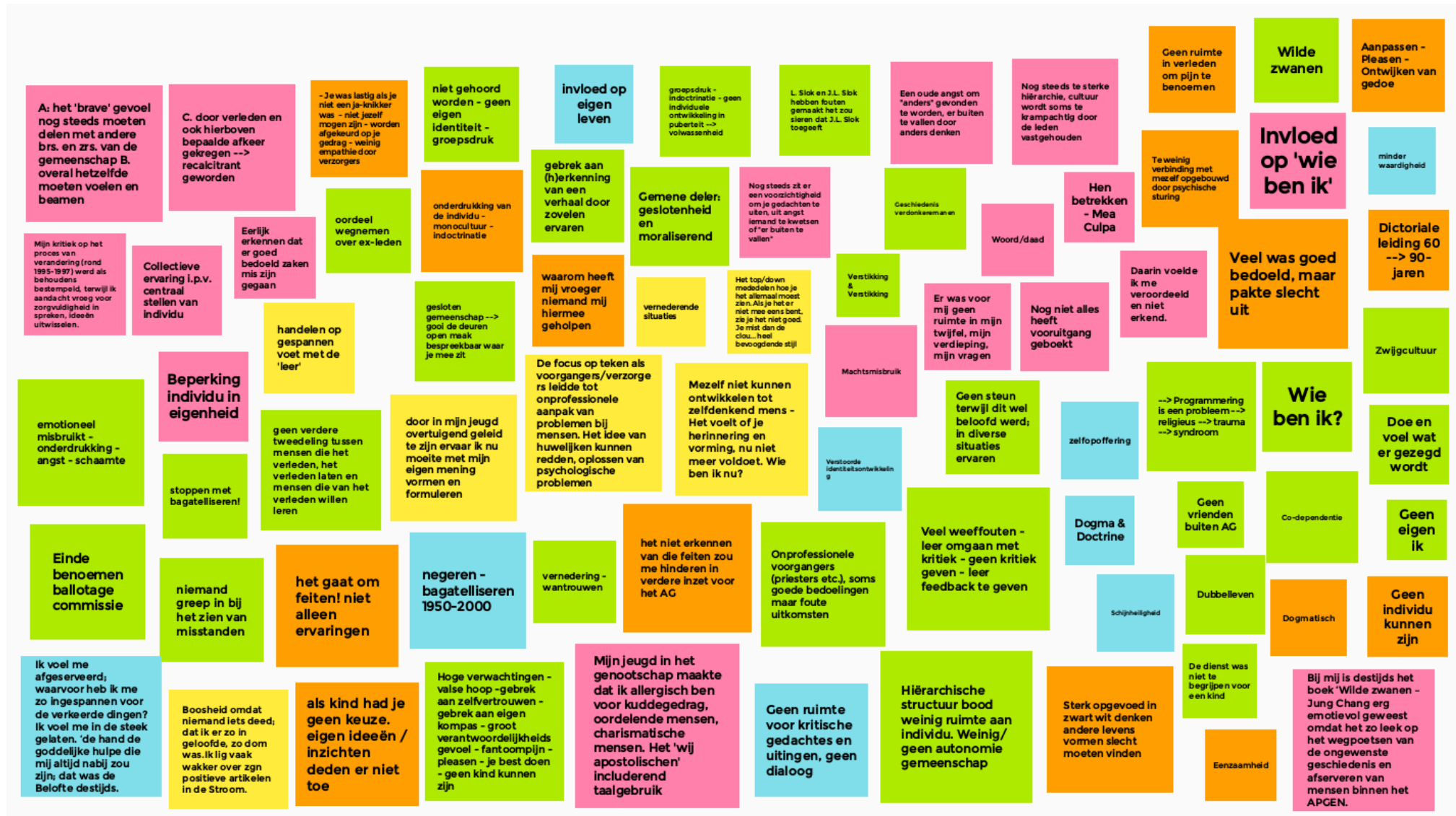
Het overzicht van de door de deelnemers op post-it achtergelaten pijnpunten/schaduwzijden (zie ook bijlage)