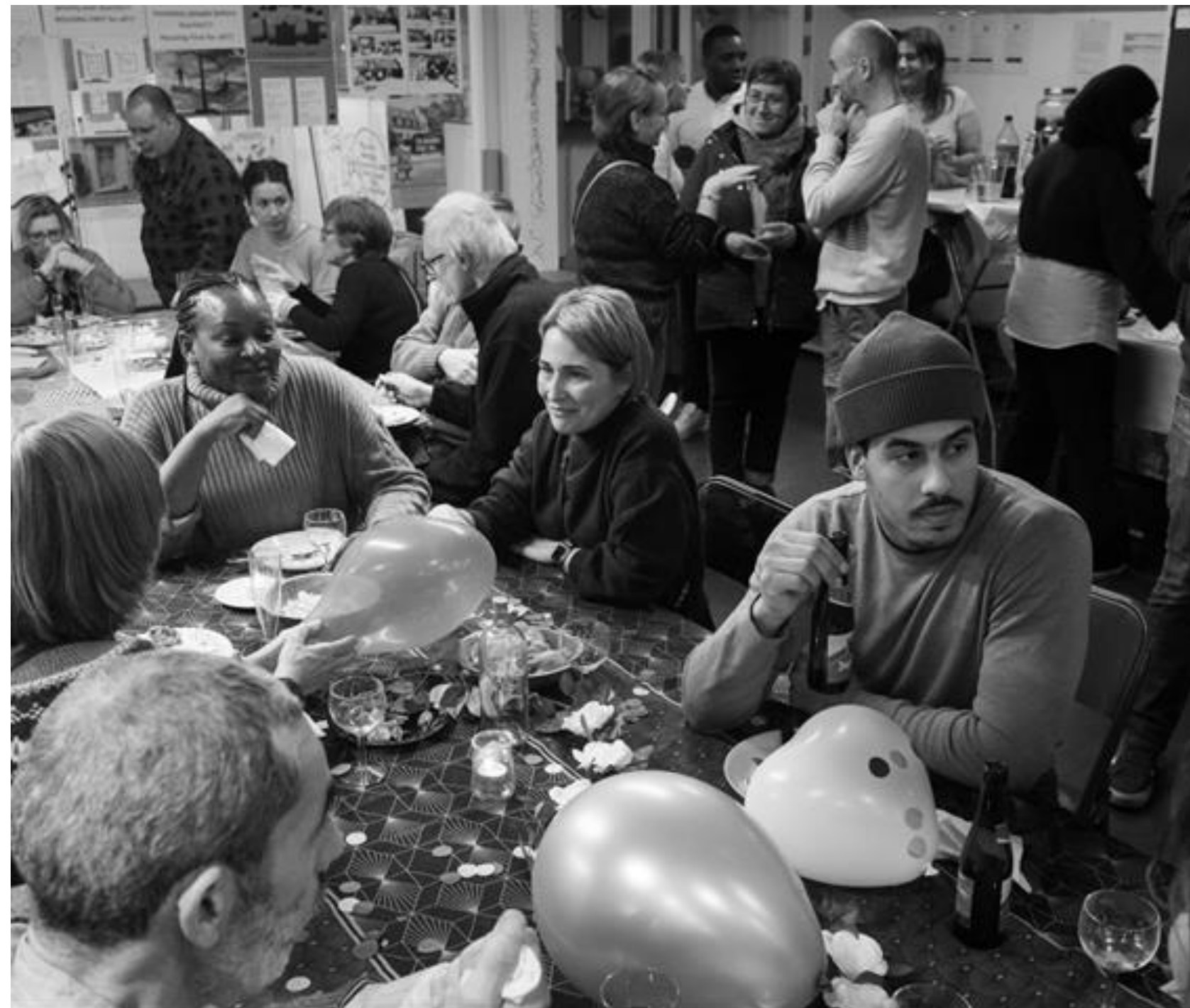
Landelijke samenwerking op kernthema's MB

Zinvol en actief bijdragen aan de maatschappij waarin we leven.